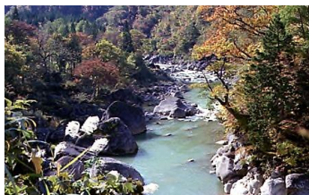
▲奥越の紅葉 昭和57年10月29日 68858