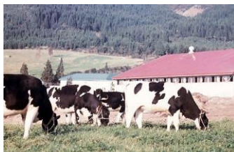
▲奥越高原牧場 昭和45年10月23日 60038