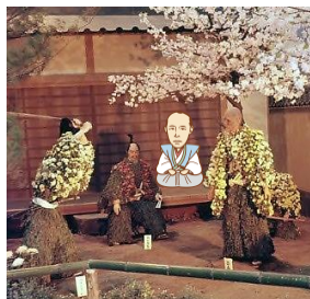
（背景）武生菊人形 昭和46年10月6日 60136